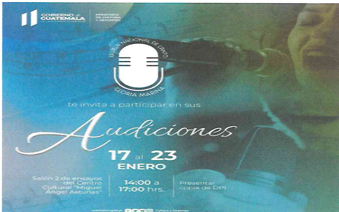
Fig: Constata la Convocatoria realizada en Redes Sociales.